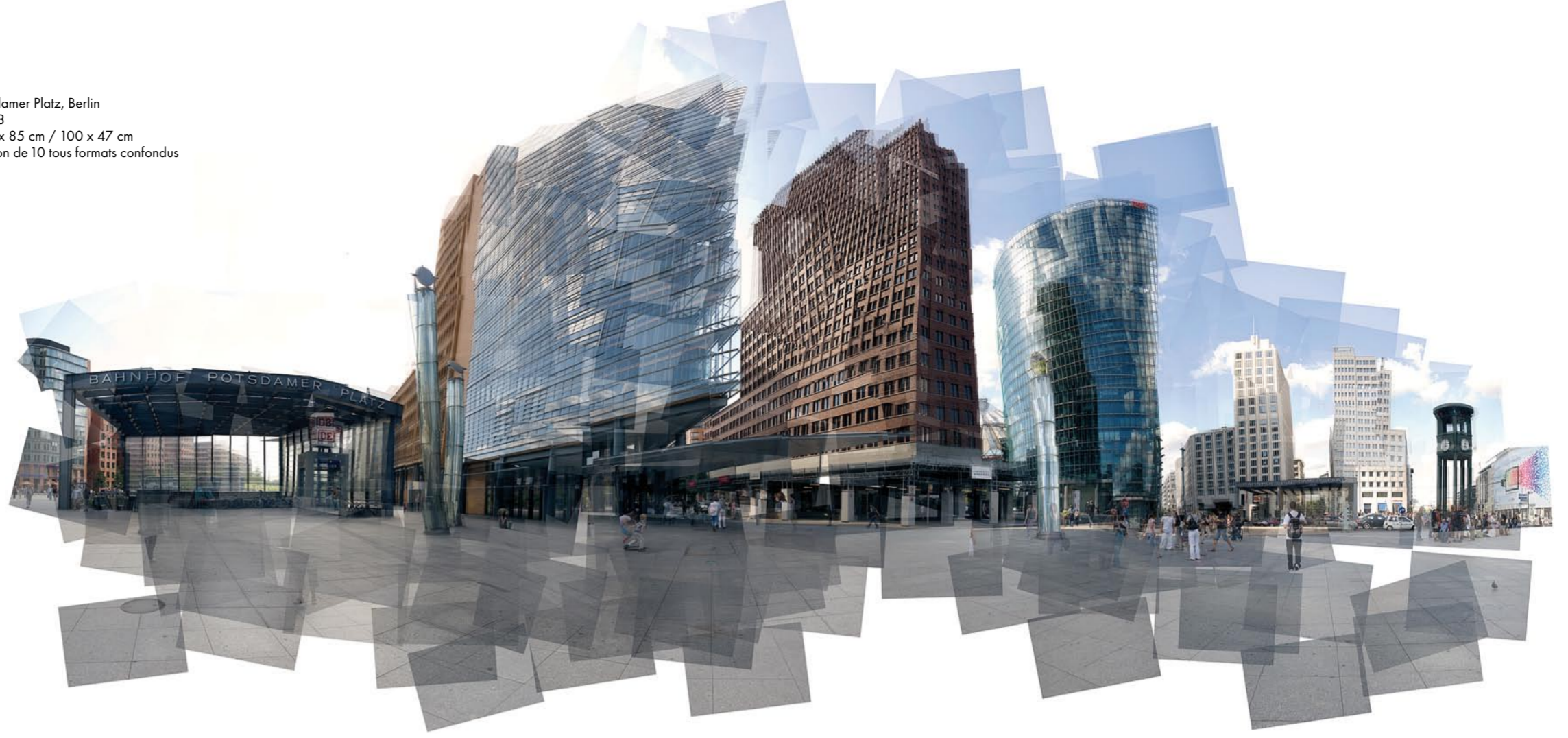
Potsdamer Platz, Berlin 2008 180 x 85 cm / 100 x 47 cm Edition de 10 tous formats confondus