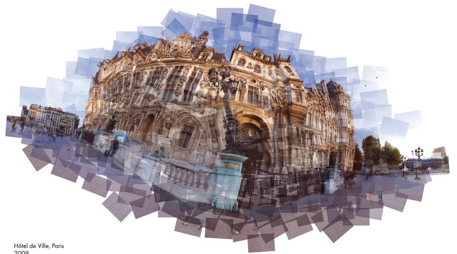
Hôtel de Ville, Paris 2009 180 x 101 cm / 100 x 56 cm Edition de 10 tous formats confondus

The viewer can see and experience the world with completely different eyes. The results are technical masterpieces: mosaic photography consisting of hundreds of individual photos, each showing high-resolution detail.